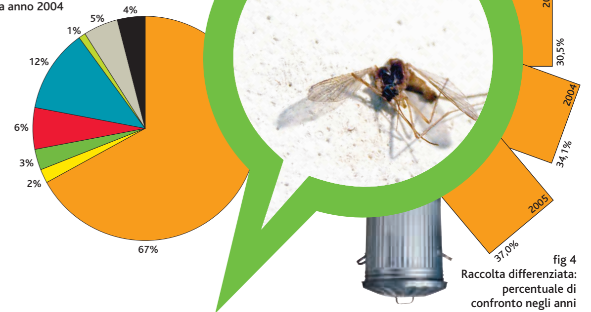
fig 4 Raccolta differenziata: percentuale di confronto negli anni

ingombranti legname organico vegetali plastica carta vetro rifiuti indifferenziati